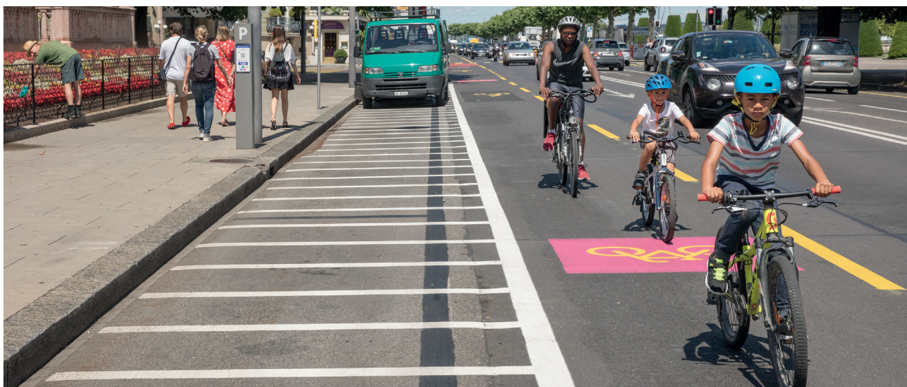
Genève, Quai du Mont-Blanc : un itinéraire sécurisé à pratiquer avec des enfants.