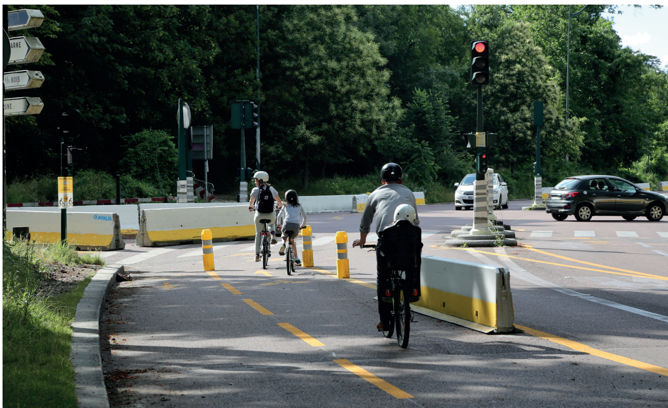
Aménagement cyclable de transition dans le Bois de Vincennes à Paris