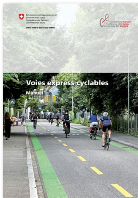
Le manuel aide à la planification et à la mise en œuvre de liaisons cyclables de qualité

Les contenus prescrits par la loi sur les voies cyclables et précisés dans le guide pratique « Planification des réseaux de voies cyclables » revêtent également une importance particulière pour l'application métier pour la mobilité douce (FA LV). C'est pourquoi l'OFROU souhaite s'assurer, avec ce lot de travail, que les contenus de la planification du réseau sont représentés de manière appropriée pour les cantons dans l'application métier du modèle de géodonnées. Aucun travail n'a été effectué dans ce cadre en 2025. Le contrat a expiré en 2025 et a été prolongé jusqu'au 30 juin 2027.