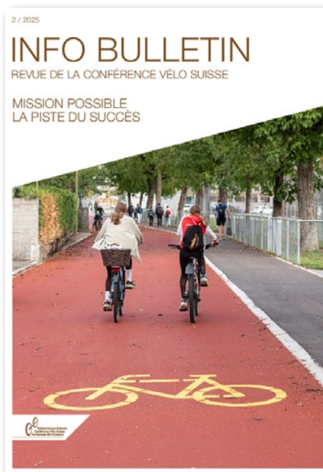
L'Info-Bulletin n° 2-2025 revient sur la journée technique