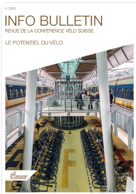
L'Info-Bulletin n° 1-2025 met en en avant le potentiel du vélo

Le 3 avril 2025 à Bâle, une visite guidée a permis d'expérimenter sur place l'« arrêt viennois » et le bypass vélo, deux aménagements innovants pour faciliter la circulation des cyclistes aux abords des arrêts de tram. Cette mini-excursion faisait écho au webinaire du 29 octobre 2024 sur le même sujet. 21 personnes y ont participé, dont des représentant-e-s de l'OFROU et de l'OFT. Liens: Mini-excursion et Webinaire