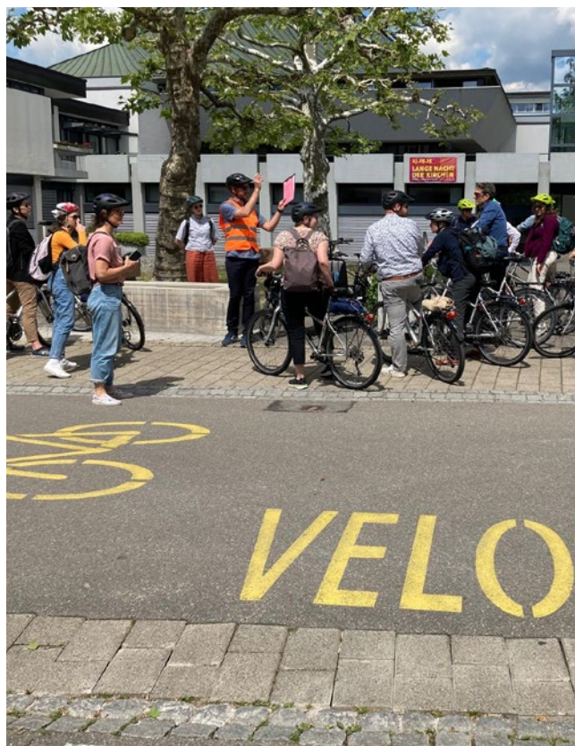
Le programme attrayant proposé par la ville d'Uster a fait découvrir aux participants de l'AG des «rues cyclables», des points de comptage, des itinéraires cyclables et une chaussée à voie centrale banalisée étroite