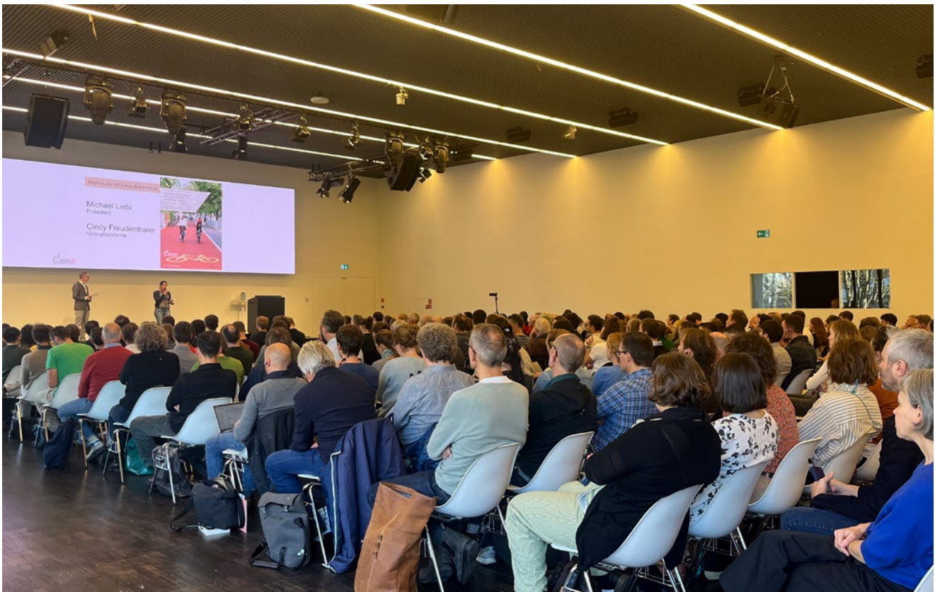
Conclusion de la journée technique 2025 : avec de la volonté, du courage, de la persévérance, des échanges et de la collaboration, la mise en place d'une Suisse favorable au vélo devient une «Mission possible»