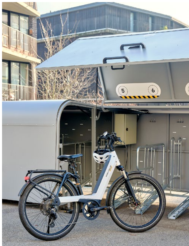
L'excursion technique nous emmènera à Lausanne pour découvrir les bandes cyclables aménagées derrière des voitures stationnées, les Vélobox et la future voie verte