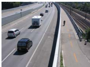
Journée technique - Place au vélo! - Lausanne 21.11.2008 Office fédéral des routes OFROU