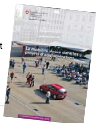
Journée technique - Place au vélo! - Lausanne 21.11.2008 Office fédéral des routes OFROU